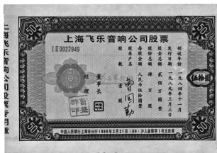
国内发行的第一张股票

8. [2024·浙南名校联盟开学考] 观察下面两幅图片,其所记录的历史事件共同反映了( )